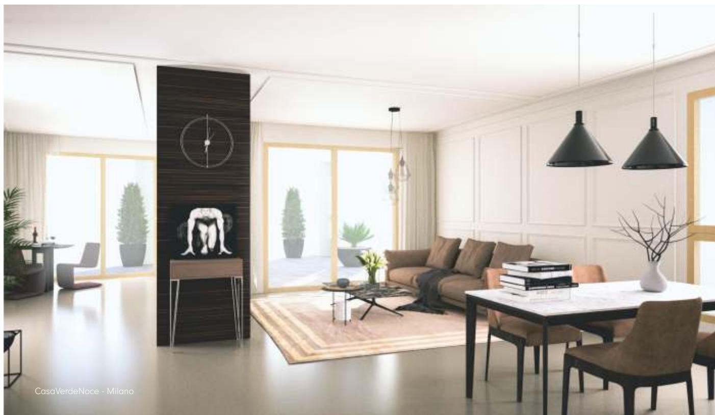
CasaVerdeNoce - Milano

impatto ambientale, l'uso di fonti energetiche rinnovabili e tecniche costruttive all'avanguardia che garantiscono alti standard qualitativi in termini di abitabilità e benessere, nonché elevati risparmi energetici ed emissioni zero. La struttura esterna è un vero e proprio "guscio protettivo" che offre massimo isolamento termo-acustico, sistema antisismico, impianto di ventilazione e purificazione dell'aria, di riscaldamento e raffrescamento, videosorveglianza. Una efficiente rete domotica consente la completa personalizzazione dell'impiantistica in ogni appartamento. Come assai vasta è la possibilità di scelta